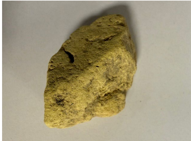
Tegel eller sandsten?