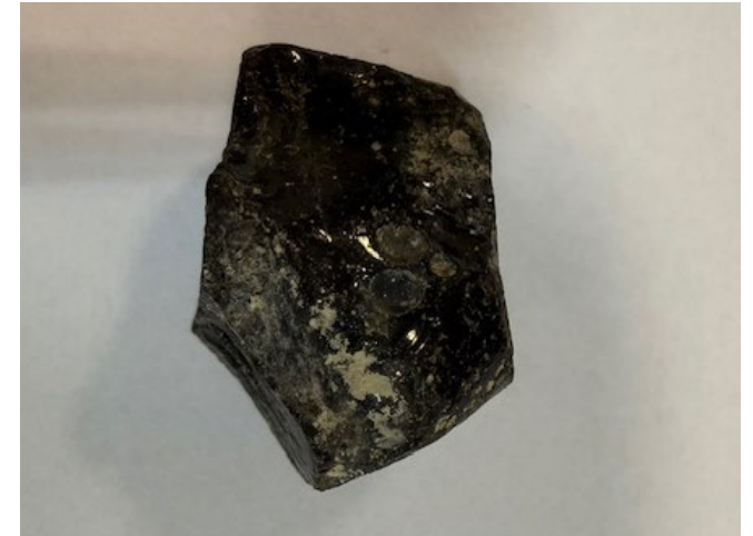
Amorf slagg eller obsidian?