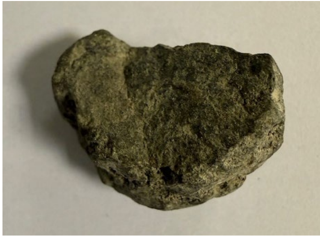
Slagg eller naturlig sten (mafisk bergart & grå kalksten)?